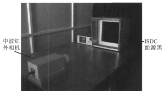
图2 中波红外相机定标示意图

为了验证本文方法的有效性,利用某一中波红外相机进行目标红外辐射测量实验。该相机如图2所示,参数如下:测量波段3.7~4.8 \mu\text{m} ,探测器像元大小15 \mu\text{m} ,输出位数14位,相机镜头口径 \phi 80\text{mm} ,焦距160mm。