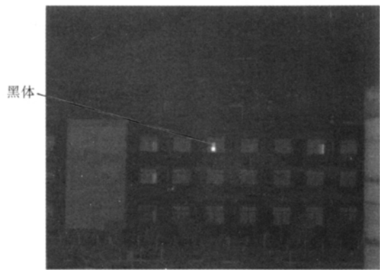
图4 55℃黑体测量图 Fig. 4 Measurement image of the blackbody at 55℃