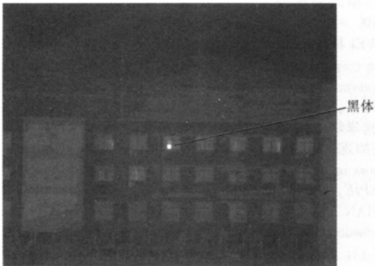
图5 85℃黑体测量图 Fig. 5 Measurement image of the blackbody at 85℃

T_H(85^{\circ}\text{C}) 下,并利用相机对黑体进行测量,分别得到测量值 DN_L 和 DN_H . 图4和图5分别给出了 55^{\circ}\text{C} 和 85^{\circ}\text{C} 黑体的测量图像.