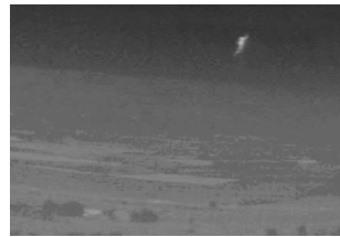
图 3 (a)红外图像

图 3(a)、(b)分别为一幅战场监视红外图像及其二值图像, 使用 C 语言在 Windows 环境下编制程序进行了实际测试, 实际提取的目标特征信息如表 1 所示, 实践结果表明该算法能够快速、准确标记图像, 提取目标特征信息。该算法可以很方便地改为提取周长、最长轴等特征量。