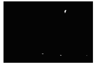
图 3 (b)二值图像